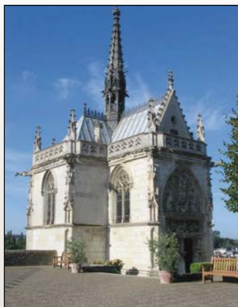
Часовня Сен-Юбер. Здесь захоронены предполагаемые останки Леонардо да Винчи