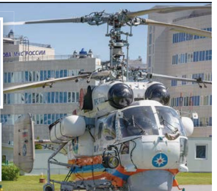
Вертолет готов к старту!

И тут как нельзя кстати вспомнились мифы древней Греции о