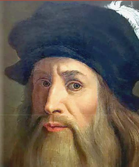
Леонардо да Винчи. Автопортрет. 1505 г.