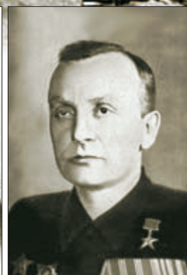
Г. С. Шпагин – его ППШ были признаны самой удачной версией автоматического оружия ближнего боя