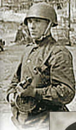
Солдаты с пистолетами-пулеметами ППШ. 1945 г.

Когда слышишь выражение «русский автомат», на ум сразу приходит изделие гениального оружейного конструктора Михаила Тимофеевича Калашникова, сто лет со дня рождения которого мы только что отметили. Однако разработка автоматического оружия в России велась еще в начале XX века. Именно благодаря усилиям первых отечественных оружейников был заложен фундамент, позволивший позже создать «калаш» – лучший автомат XX века.