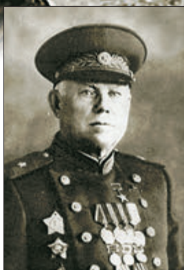
Знаменитый оружейник В. А. Дегтярев

Выпуск автомата Федорова прекратили лишь в 1925 году. К тому времени на вооружении в Красной Армии состояли 3200 автоматов. Их отправили на склады. А в 1940-м, в разгар войны с Финляндией, выяснилось, что советским бойцам катастрофически не хватает ручного скорострельного оружия. Автоматы Федорова были изъяты со складов и поступили на Карельский фронт. Ими вооружали самые боеспособные части – в основном разведчиков. Бойцы позже отмечали, что автоматы Федорова продемонстрировали самые лучшие качества. К тому времени их создатель уже отошел от активной конструктор-