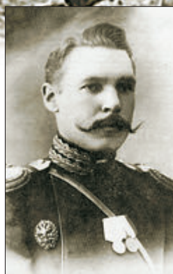
Офицер-артиллерист В. Г. Федоров, создатель первого русского автомата