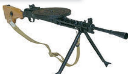
Ручной пулемет Дегтярева

Федоров постоянно совершенствовал свое изделие, и правительство уже готово было запустить его в массовое производство, но началась Первая мировая война. Лишь в 1916 году правительство-таки расщедрилось и заказало 25 тысяч автоматов Федорова Сестроречскому оружейному заводу. Однако из-за трудностей военного времени заказ пришлось снять. На вооружение армии поступили лишь десятки автоматов. И хотя у оружия хватало недостатков (автоматы были довольно тяжелы, не слишком удобны в обращении, чувствительны к загрязнению), появление их на Румынском