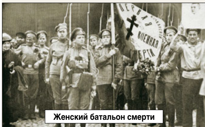
Женский батальон смерти

Реклама. ИП Кропалев А.Я., ИНН 471400094748