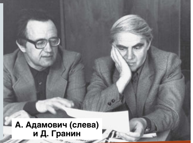
А. Адамович (слева) и Д. Гранин

Фонд сохранения и популяризации наследия Даниила Гранина, Центральный государственный архив литературы и искусства Санкт-Петербурга, Государственный музей политической истории России приглашают на выставку «Люди хотят знать», посвященную 40-летию выхода «Блокадной книги», 75-летию полного освобождения Ленинграда от фашистской блокады и 100-летию со дня рождения писателя Даниила Гранина.