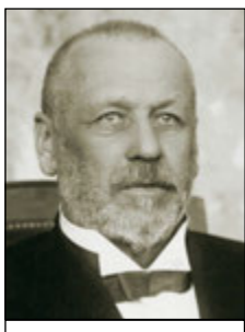
М. В. Родзянко

Яшка призналась Родзянко, что мечтает создать женские боевые добровольческие батальоны. Эта мысль показалась Михаилу Владимировичу интересной, и в начале мая 1917 года он привез Марию в Петроград. Керенский идею Бочкаревой поддержал сразу.