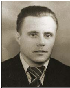
Владимир Спиридонович Путин (1911–1999)

А я продолжал беседу и приводил два факта из военной истории: одна была из 75-летнего прошлого, а другая – не столь давняя.