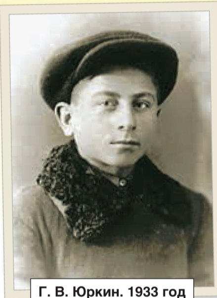
Г. В. Юркин. 1933 год